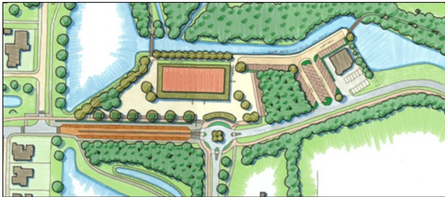
Afbeelding 1: aangepast schetsontwerp 28 oktober 2025

Men kon ook een inspraakreactie indienen. Van deze mogelijkheid hebben 26 mensen gebruik gemaakt. Op basis van de reacties hebben wij de inrichtingsschets en het omgevingsplan heroverwogen en aangepast. In de afbeelding hieronder ziet u de aangepaste inrichtingsschets. Daaronder leggen wij de drie aanpassingen uit.