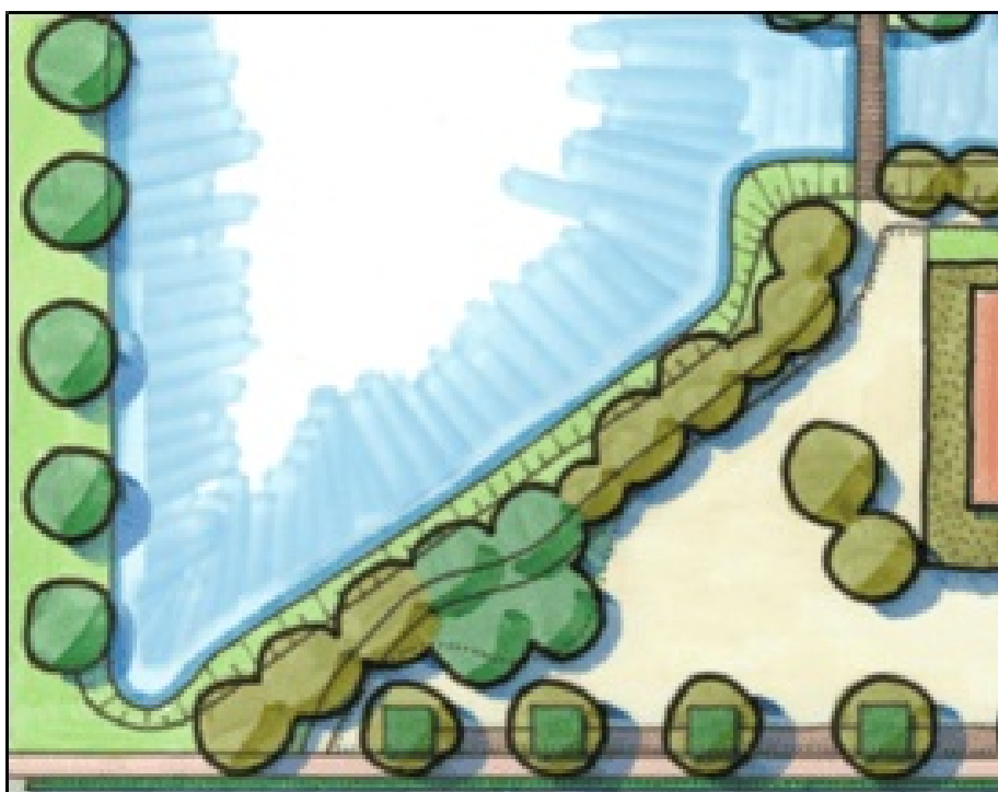
Afbeelding 6: aangepast ontwerp bomenwal 28 oktober