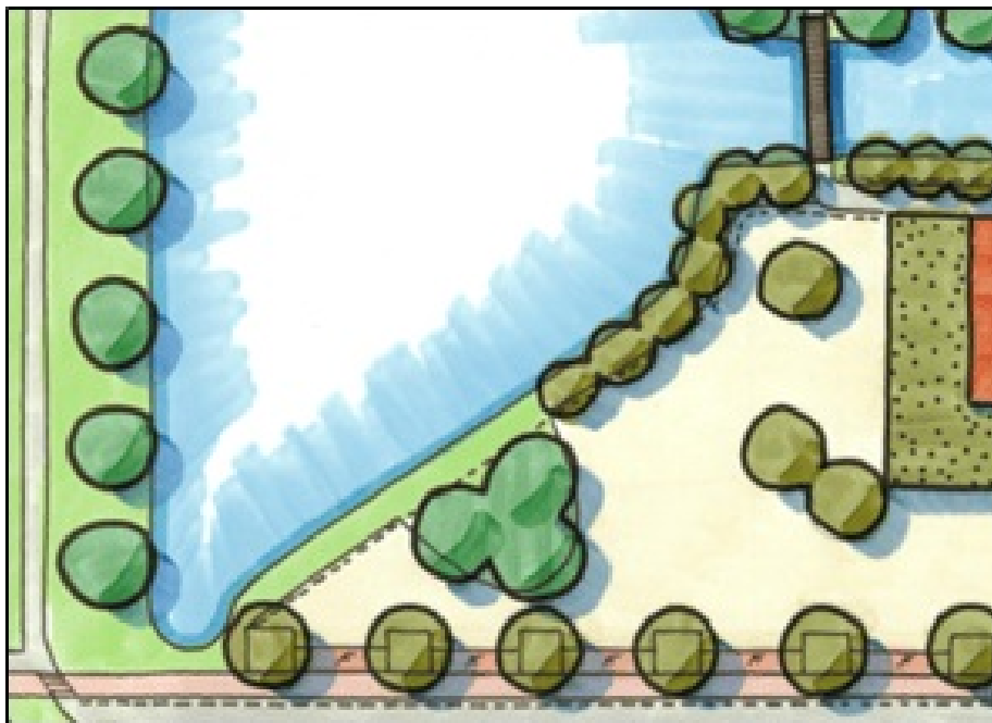
Afbeelding 5: bomenwal ontwerp 2 oktober