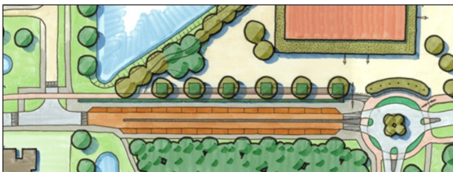
Afbeelding 2: schetsontwerp 28 oktober ingezoomd op de westelijke Kiss & Ride zone

Aan de zuidkant van de Maarsbroek is een strook met 14 extra Kiss & Ride parkeerplaatsen ontworpen. De strook aan de noordkant is in het ontwerp met twee Kiss & Ride plaatsen naar het westen uitgebreid. Hiermee komt het totaal aantal Kiss & Ride parkeerplekken op 32. Om te voorkomen dat er verspreide oversteekbewegingen vanaf de zuidelijke Kiss & Ride strook ontstaan, is de weg met één meter verbreed en in het midden voorzien van een middengeleider met een hekwerkje. Door deze ingreep ontstaat er één veilige oversteekplaats voor kinderen, dicht bij de rotonde. De kruising Maarsbroek/De Renne wordt voorzien van een verhoogd kruisingsplateau.