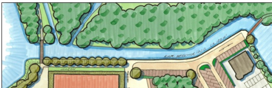
Afbeelding 4: verbindend voetpad tussen beide bestaande bruggen. Oostelijk gedeelte langs de nieuwe kade, westelijk gedeelte langs de noordzijde van het kindcentrum.

Om de onderlinge verbinding tussen de beide bestaande voetgangersbruggen in het plangebied te kunnen handhaven, is ten noorden van het kindcentrum een openbaar voetpad ontworpen. Om dit mogelijk te maken is het gebouw ruim twee meter naar het zuiden verschoven en is ook de noordgevel trapsgewijs vormgegeven. Dit is gedaan voor een wat vriendelijkere beleving van het gebouw vanaf deze wandelroute. Aan de noordkant van het gebouw is een 2,5 meter brede groenstrook ontworpen; deze wordt door een 180 cm hoog transparant hekwerk gescheiden van het openbare voetpad. Hierdoor blijft de school gevrijwaard van graffiti en andere vernielingen en kunnen zonder risico's raamopeningen in de noordgevel worden aangebracht. Deze raamopeningen versterken het gevoel van sociale veiligheid voor wandelaars die van het pad gebruik maken. Tegelijk blijft er ondanks het opschuiven van het schoolgebouw voldoende oppervlakte schoolplein over.