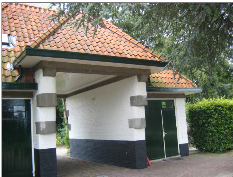
Toegangspoort begraafplaats Musselkanaal 1 en 2