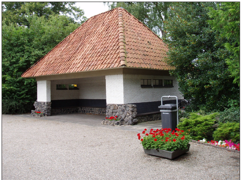
Wachruimte op de begraafplaats Stadskanaal-Brugstraat