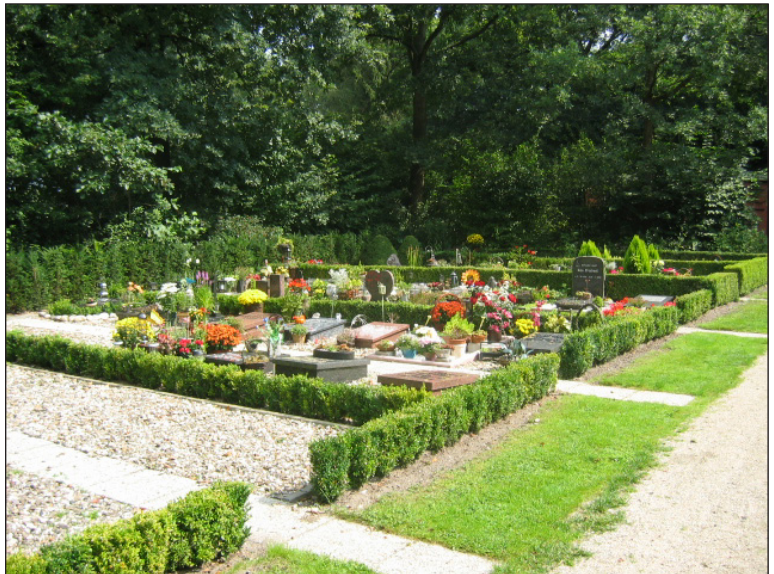
Urnengraven op de begraafplaats Stadskanaal-Ceresstraat